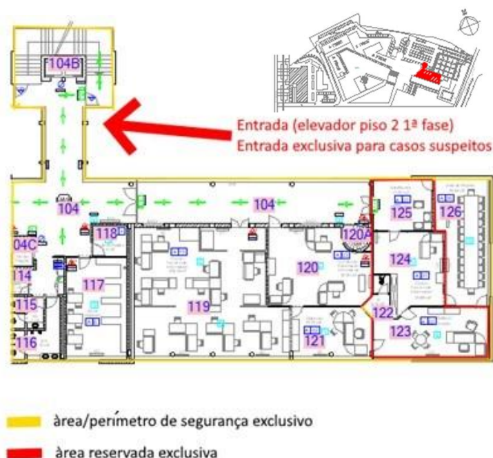
Figura 1 – Esquema do edifício/área destinada a área de isolamento da UPT

De acordo com os procedimentos específicos nomeadamente os indicados no ponto 4.3.1. qualquer estudante/colaborador com sinais e sintomas de COVID-19 e ligação epidemiológica, deverá colocar de imediato o equipamento de proteção das vias respiratórias (máscara cirúrgica) e luvas e, na presença do colaborador designado, dirigir-se para a área de isolamento ou manter-se no espaço no caso de ser este o espaço a confinar.